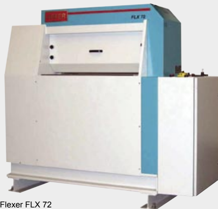
Flexer FLX 72